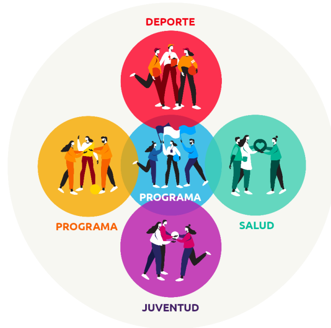
Enfoque de liderazgo unificado 1